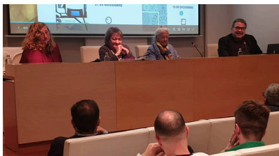
Imagen de la junta 2023.

El jueves 6 de junio de 2024, a las 18.00 horas en primera convocatoria y 18.30 horas en segunda , se realizará la asamblea ordinaria de socios, en la sala de prensa de Afundación.